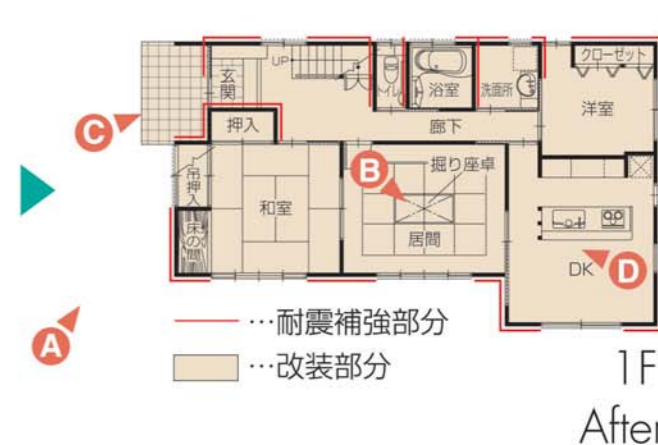
A/耐震補強工事と合わせて、モルタル塗り壁をサイディングボードに張替え、落ち着いた色味に改装。 B/リビングは中央にへりのない琉球畳を敷き、モダン和風に。中央のたたみ2枚は外し、掘り座卓にします。 C/門まわりは木曽石、アプローチは真砂土に御影石。自然素材ならではの質感が、住宅や植栽と美しく調和。 D/東南の一番、居心地の良い場所にダイニングを。3本の柱をアクセントにした、ウッディテイストの対面キッチン。