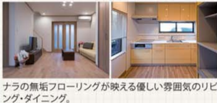
ナラの無垢フローリングが映える優しい雰囲気のリビング・ダイニング。