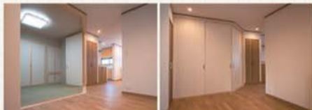
大型の可動間仕切り戸により、空間を広く使えたり、個室として使えたりできる和室はご主人のお気に入りのスペース。