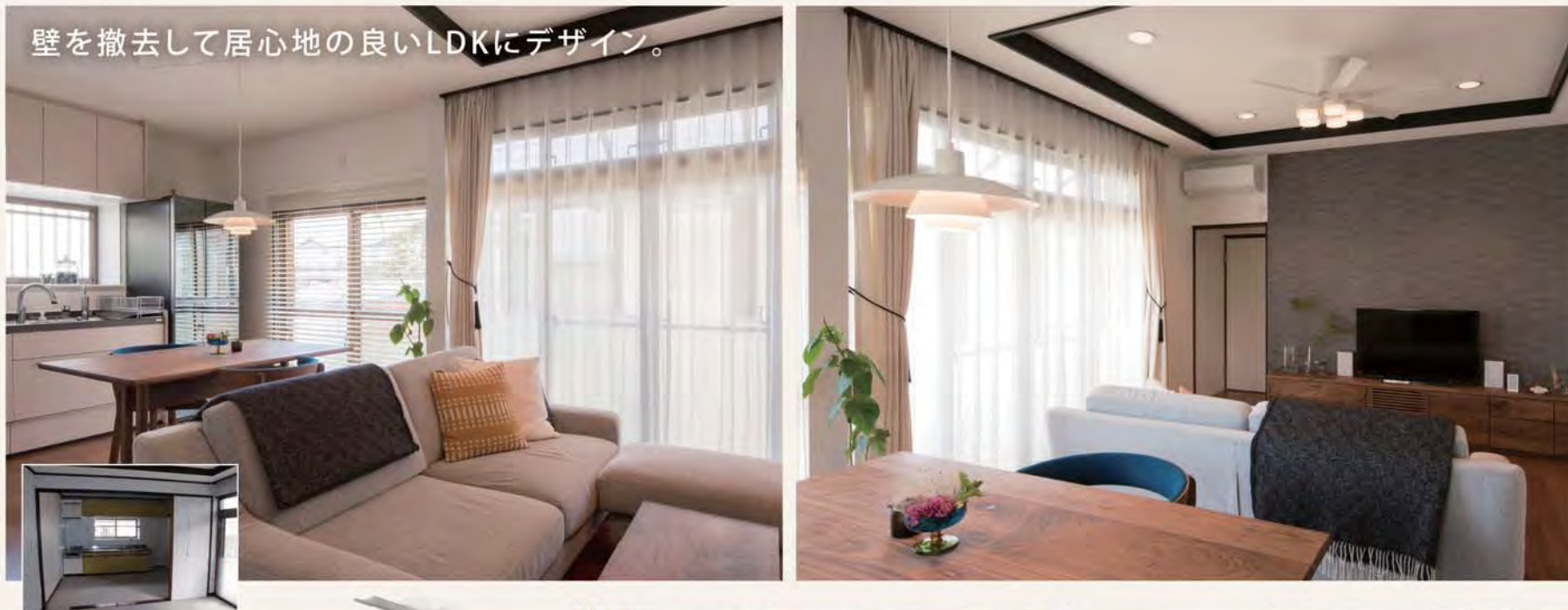
壁を撤去して居心地の良いLDKにデザイン。