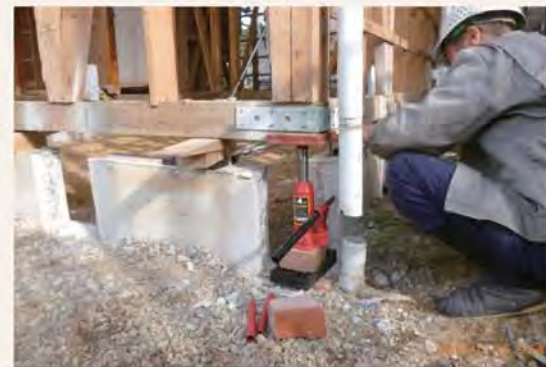
1階建物内外をすべて解体しスケルトンに。既存の基礎を部分的に撤去しジャッキアップ。