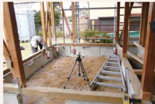
最終的に9cmジャッキアップ。