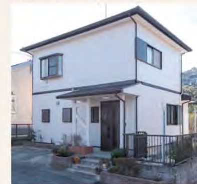
外壁塗装、屋根カバー工法での葺替えも実施し、外観も一新しました。