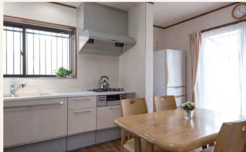
採光や導線、使い勝手などを考慮し最新のシステムキッチン、システムバスでレイアウト変更。外部改修もおこない、シンプルで落ち着きのある住まいへと生まれ変わりました。