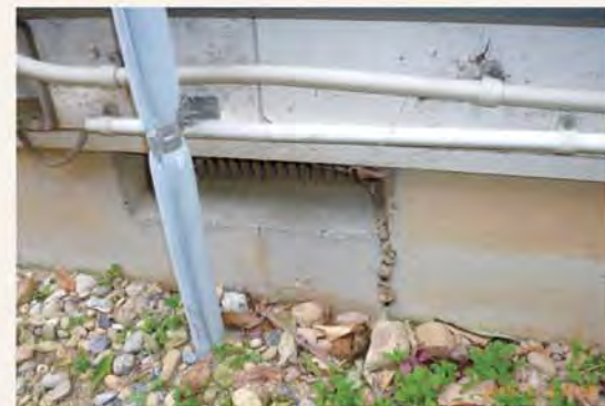
数ヶ所の基礎クラックを確認。室内でも傾斜、最大6cmを確認。