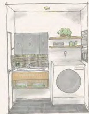
0.75坪の洗面スペースに、デザインで広がり演出。