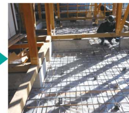
無筋の基礎だったため、外周部とベース部分にすべて配筋をしてベタ基礎に。増築部分には地盤改良工事をおこない、沈下しないように工夫しました。