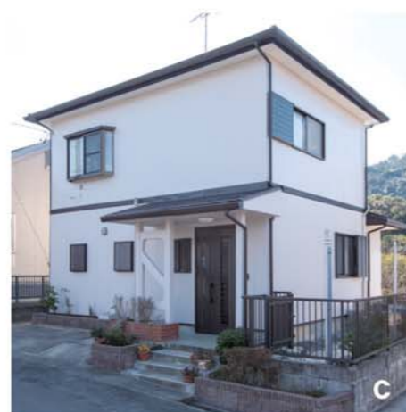
〔完成〕 外壁塗装、屋根カバー工法での葺替えも実施し、外観も一新しました。