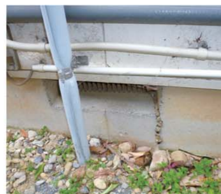
数ヶ所の基礎クラックを確認。室内でも傾斜、最大6cmを確認。