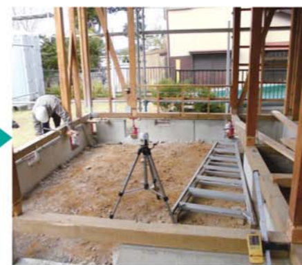
最終的に9cmジャッキアップ。