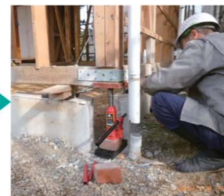
1階建物内外をすべて解体しスケルトンに。既存の基礎を部分的に撤去しジャッキアップ。